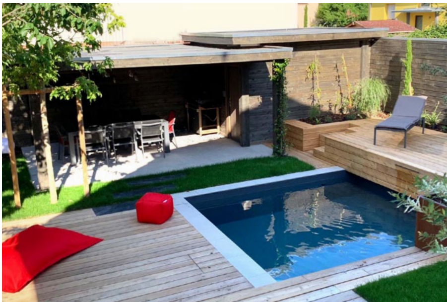
Finition autoclave gris / Porte battante pleine et décalée sous la partie auvent / Option : Fermeture pleine sur partie auvent