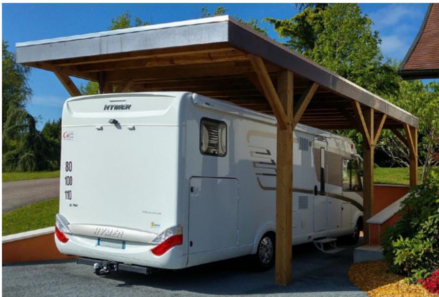
Finition autoclave marron / Habillage des bandeaux en aluminium / Avancée de toiture / Sans débord de toiture