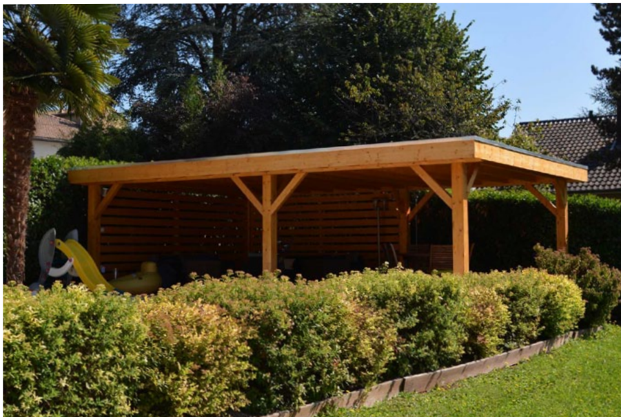
Lasure non comprise / Configuration sur mesure avec fermetures ajourées