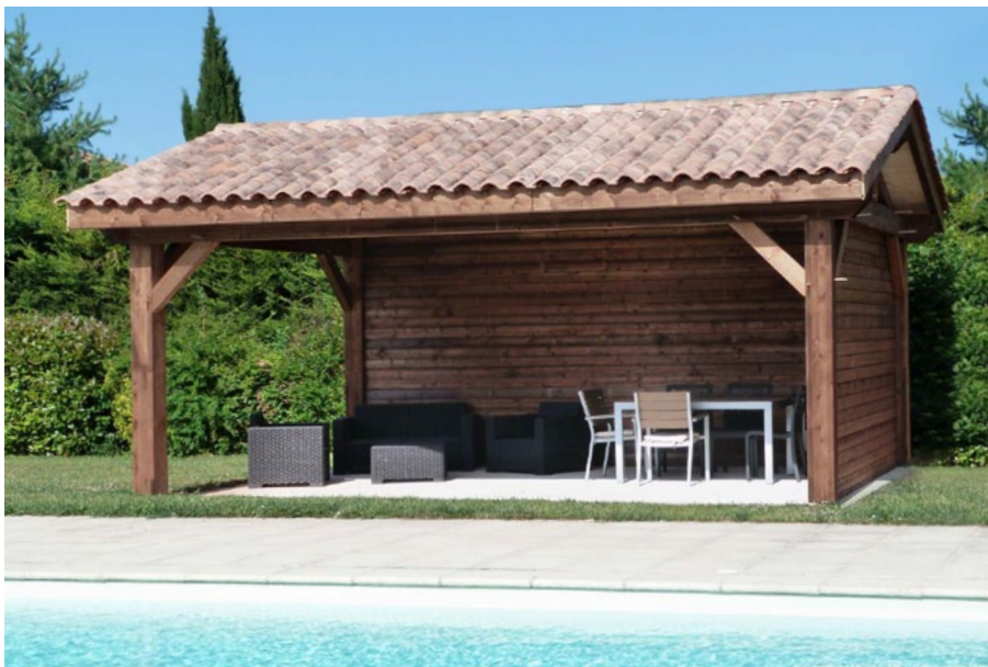
Tuiles non comprises / Finition autoclave marron